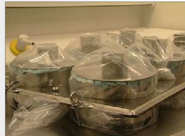
Motstånd mot mikrobiologisk penetration – torr