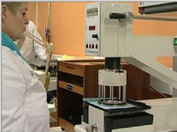
Motstånd mot vätskepenetration