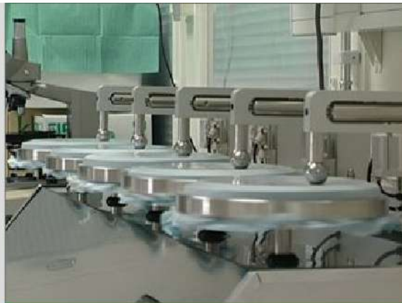
Motstånd mot mikrobiologisk penetration – våt